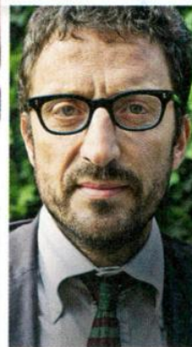
La rubrica "Divi che leggono" sui libri in uscita è temporaneamente sospesa.