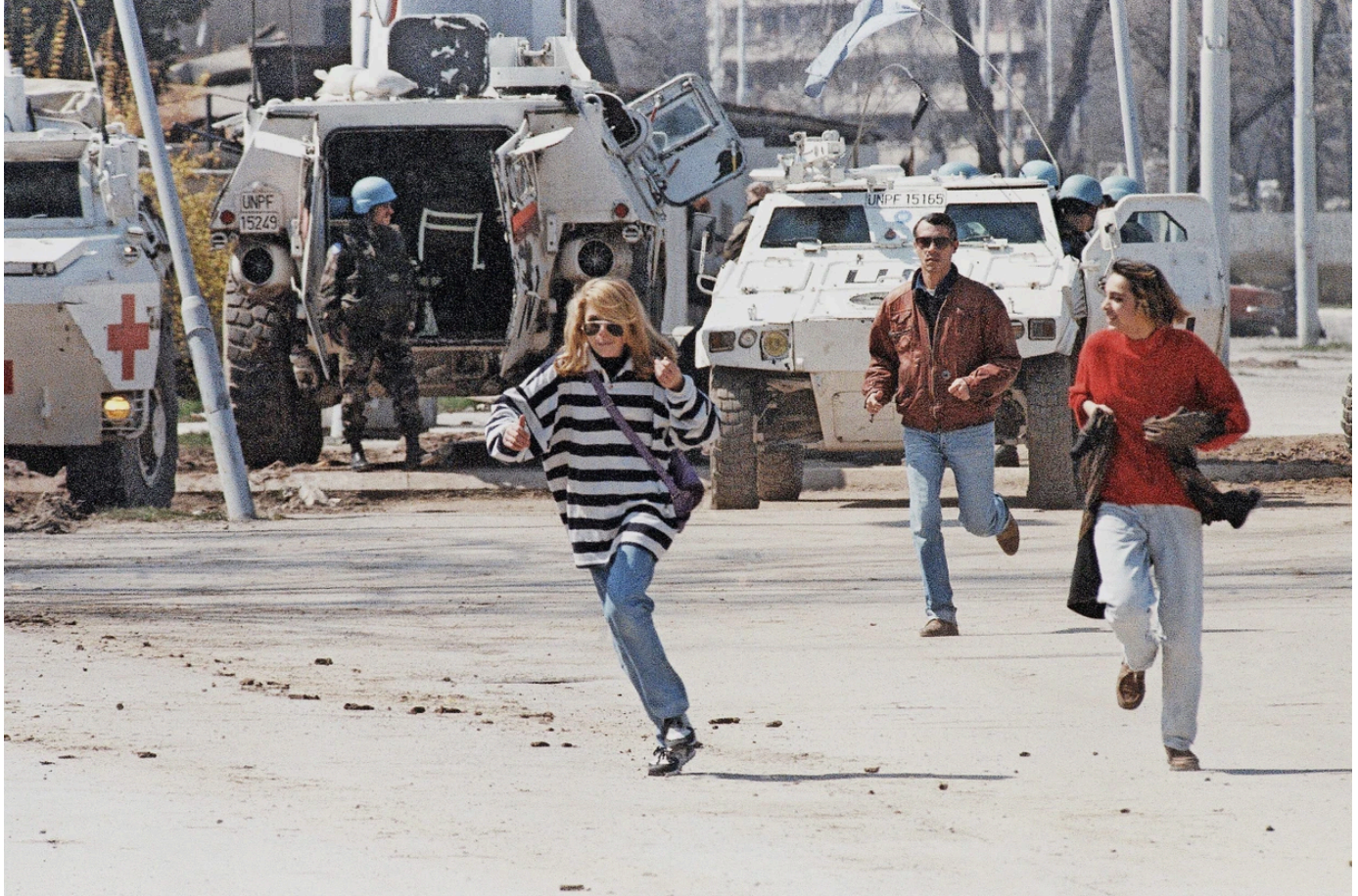
Sarajevo, 5. April 1995: Das Rennen auf der Straße, um den Kugeln der Scharfschützen zu entgehen, gehörte zum Alltag

Die Männer selbst hätten von einem Kurzurlaub gesprochen, zu dem die Jagd auf Menschen gehört haben soll. Von zentraler Bedeutung für die Justiz könnten unter Umständen auch die Aussagen des „Franzosen“ sein, der angibt, „Reisegruppen“ von Mailand aus nach Bosnien begleitet zu haben. Im Auftrag einer Organisation, die den Mord an Zivilisten offenbar als eine Art Rundum-Sorglos-Wochenendpaket an wohlhabende Bürger verkaufte, nach heutigem Kurs für einen Preis von bis zu 200.000 Euro. Freitags brach man mit einem Kleinbus in Mailand auf, sonntags kehrte man nach Hause in sein Leben als angesehener Arzt, Notar, Unternehmer, Richter oder Anwalt zurück.